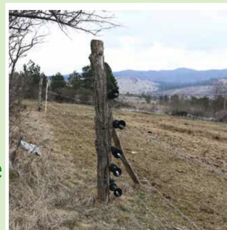
Primer stalne večžične elektroograje