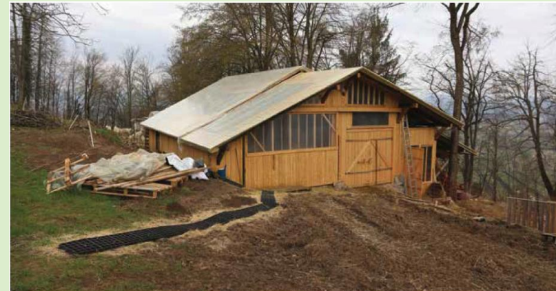
Primer lesene staje