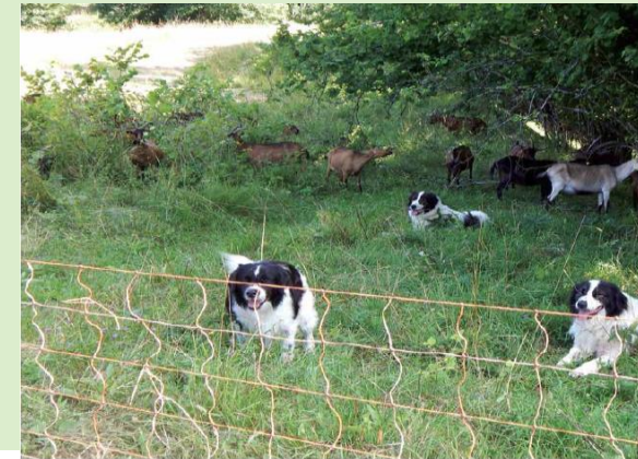
Ograjevanje z električno in prisotnost vsaj treh pastirskih psov spada med najbolj učinkovite načine varovanja drobnice pred volkami.